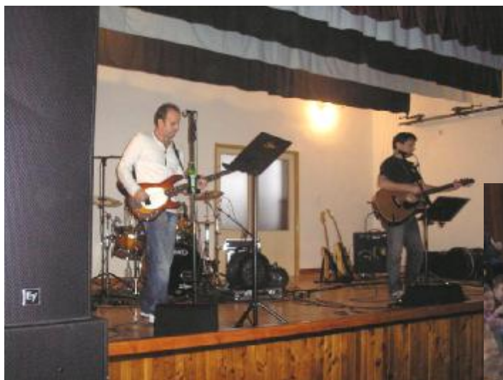
Skupina AYA u nás!