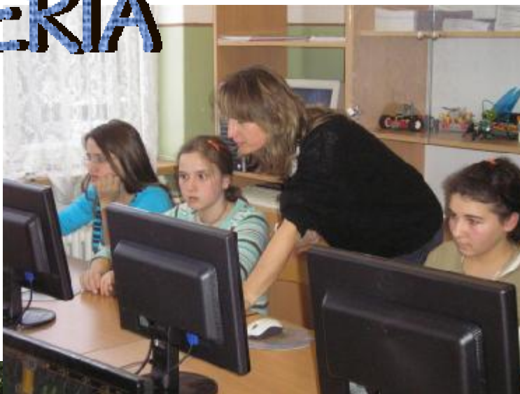
Práca redakčnej rady