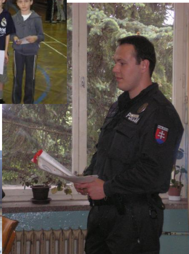
Mobilné detské dopravné ihrisko