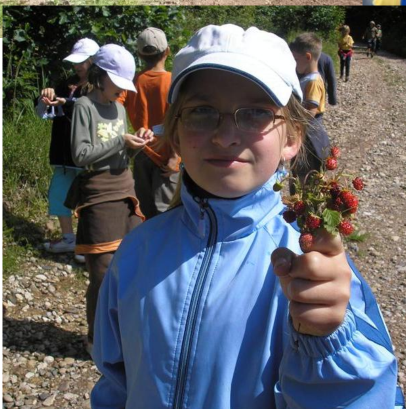
Zo školského výletu