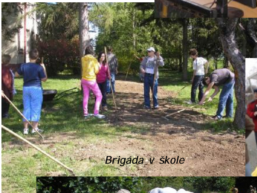
Brigáda v škole