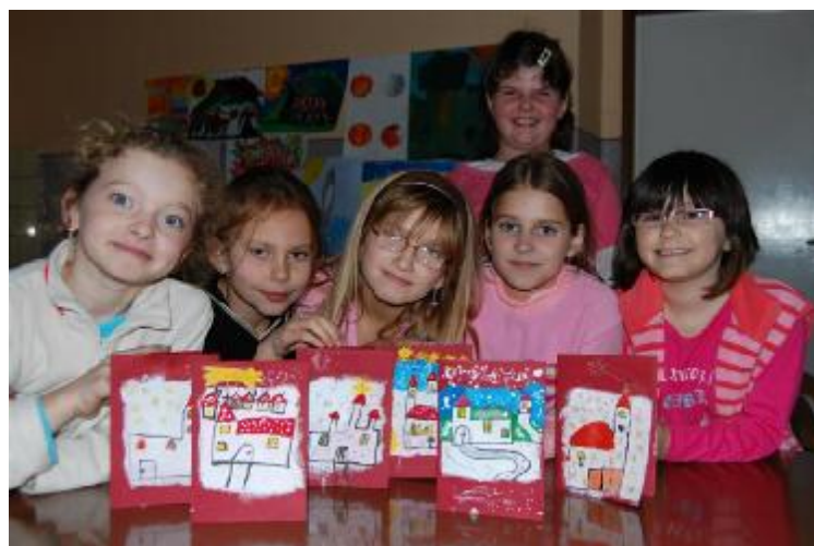
Z činnosti výtvarného odboru ZUŠ