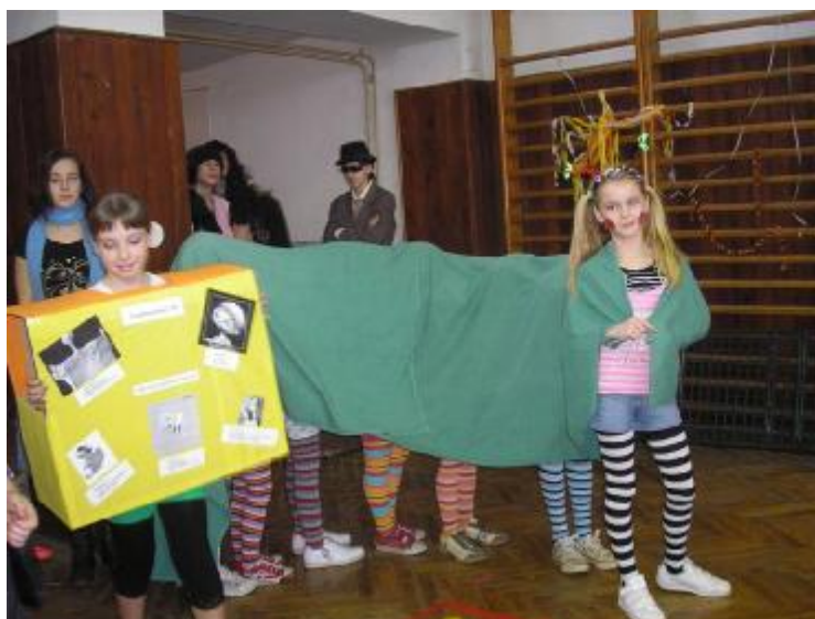
Spomienka na karneval